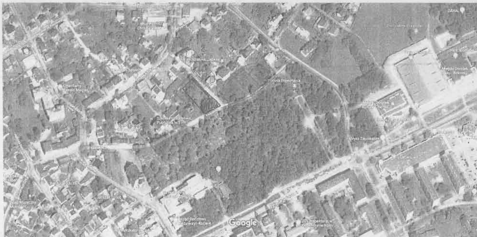
Zdjęcia © 2019 CNES / Airbus, Zdjęcia © 2019 CNES / Airbus, GEODIS Brno, Maxar Technologies, Dane mapy © 2019 Google 20 m