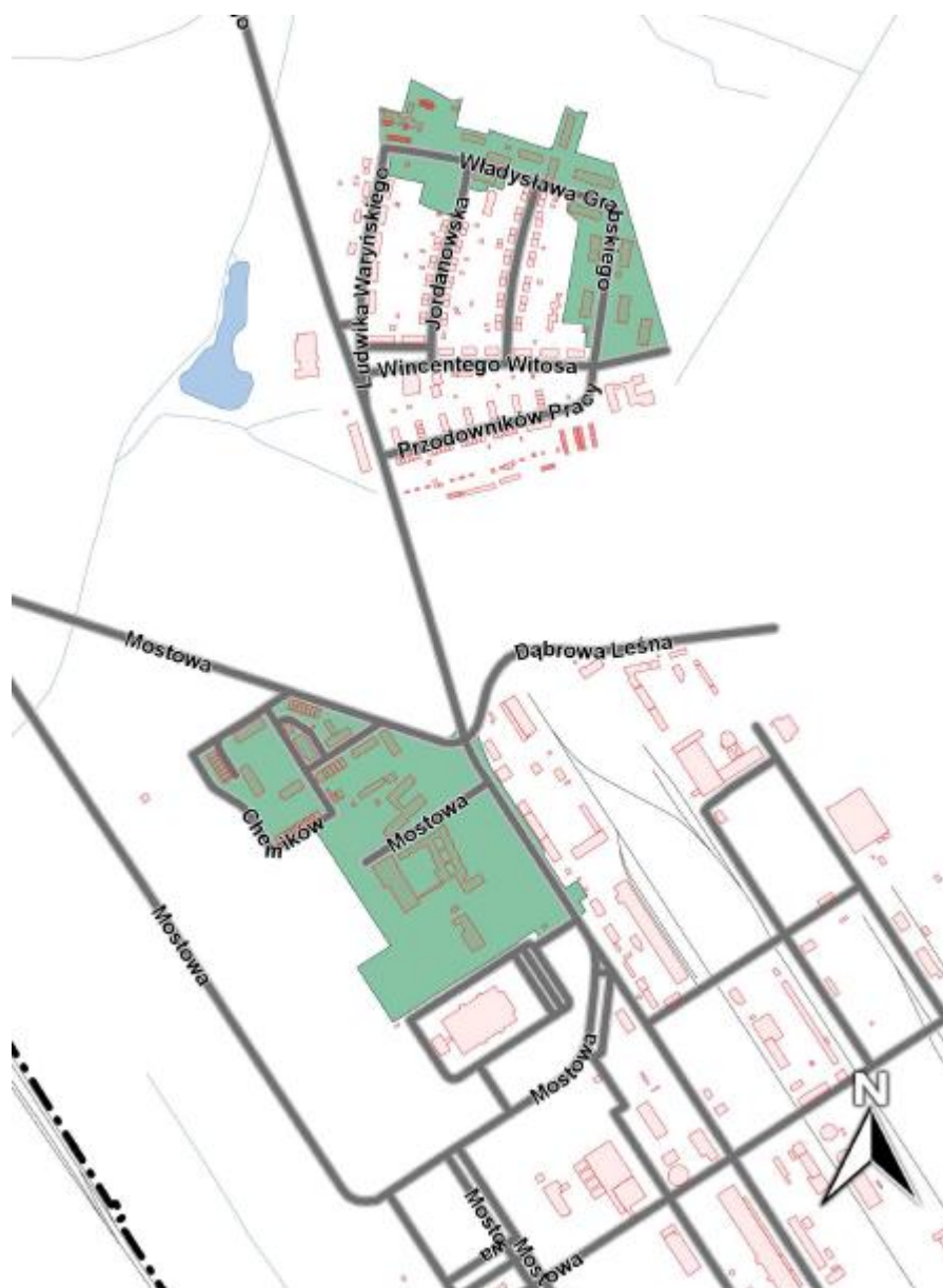
Mapa 4. Podobszar rewitalizacji Azoty