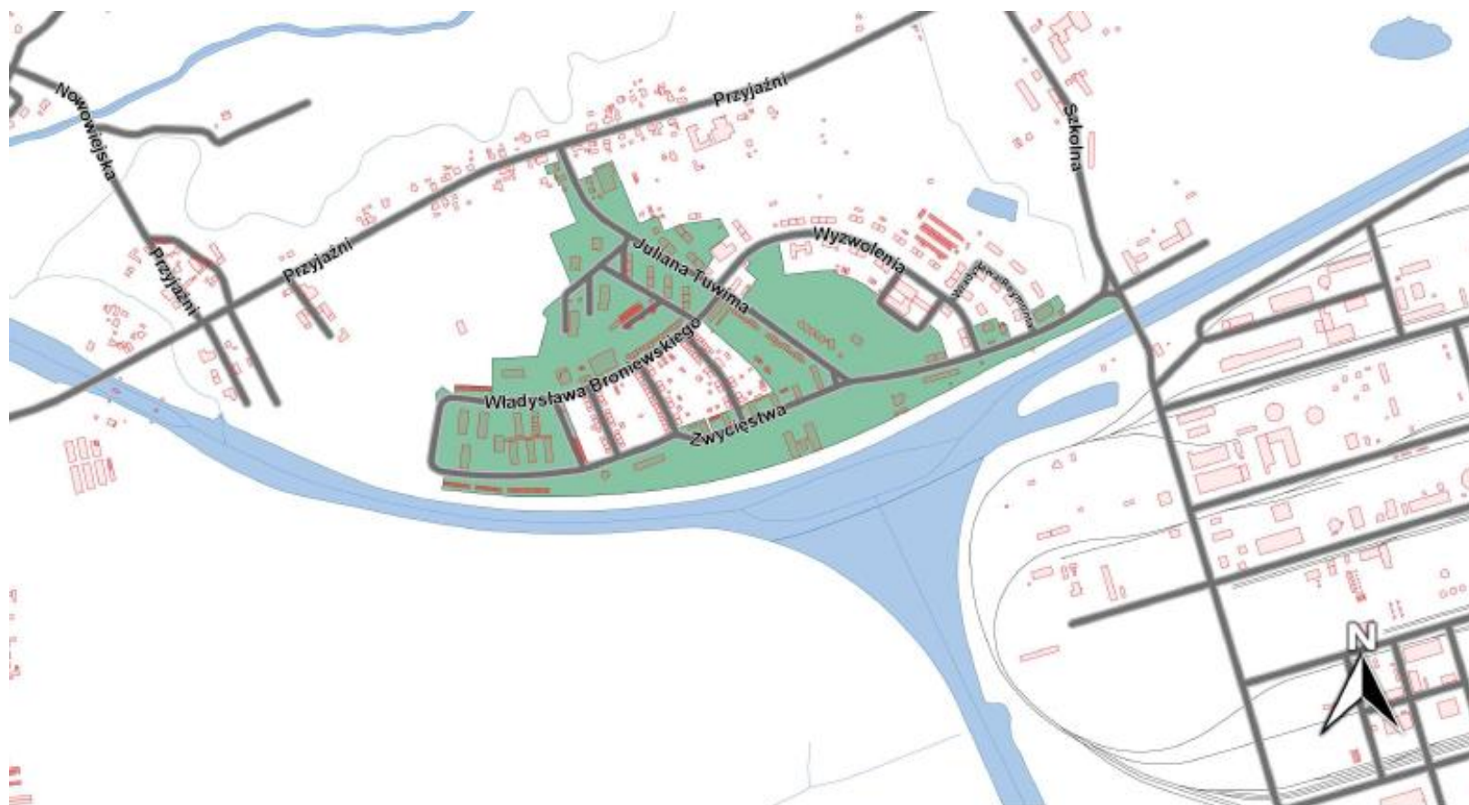
Mapa 3. Podobszar rewitalizacji Blachownia