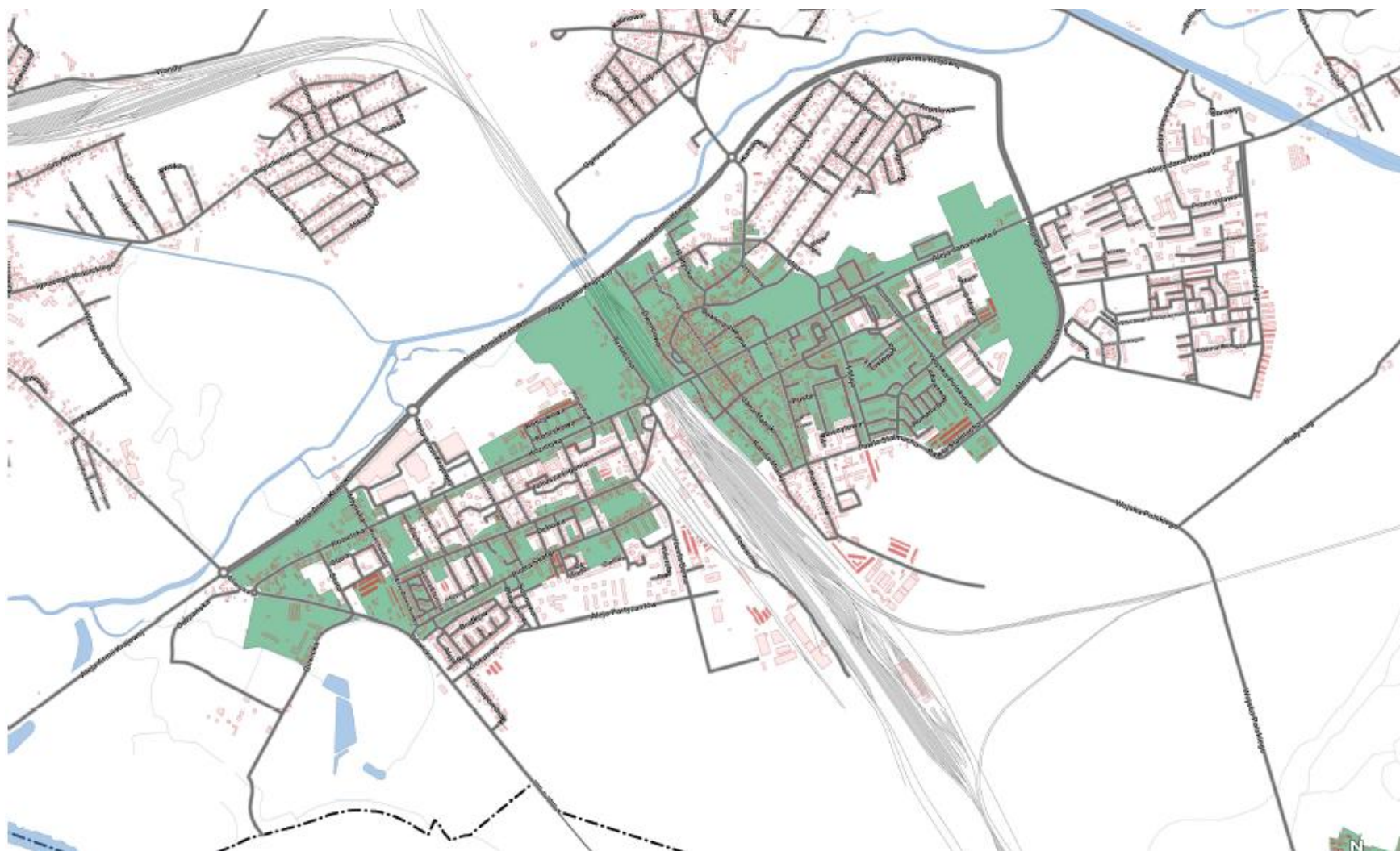
Mapa 2. Podobszar rewitalizacji Centrum