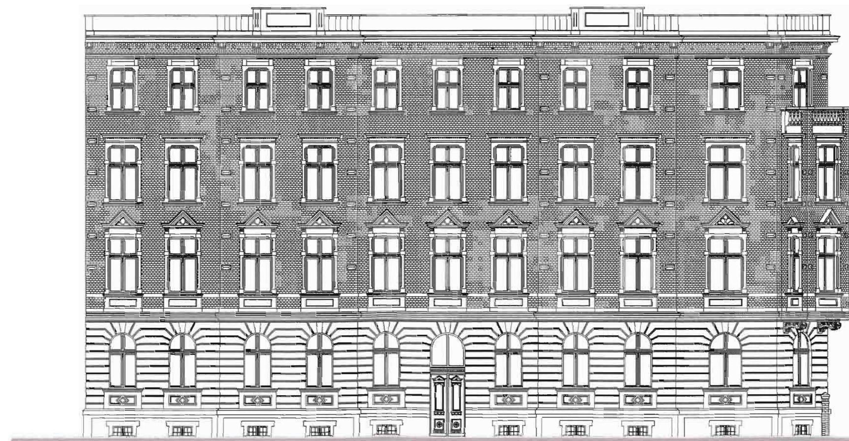
ELEWACJA PÓŁNOCNA-WSCHODNIA OD UL. ŁUKASIEWICZA