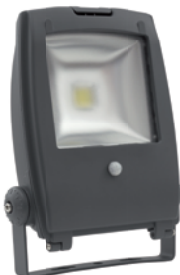
RINDO MCOB-30-GM SE