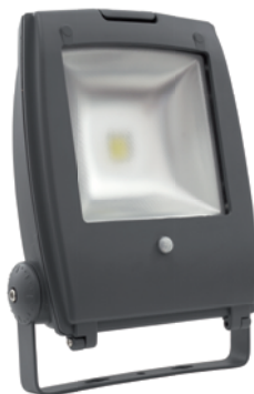
RINDO MCOB-50-GM SE