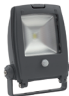
RINDO MCOB-10-GM SE