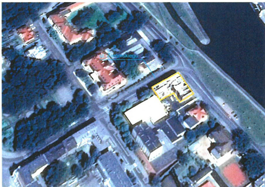
Rys. 1. Lokalizacja budynku- zdjęcie satelitarnie

Zabudowę stanowiącą przedmiot niniejszego opracowania stanowi budynek istniejący na skrzyżowaniu ulic Żeromskiego i Łukasiewicza w Kędzierzynie-Koźlu na działce nr 1849/1. Pokazano to na zdjęciu satelitarnym poniżej.