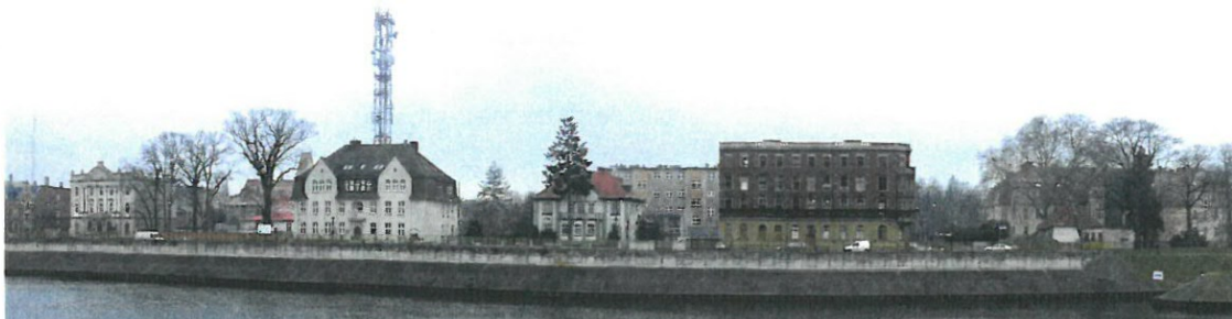
Rys. 3. Widok rejonu inwestycji od strony Odry, stan 2018r.