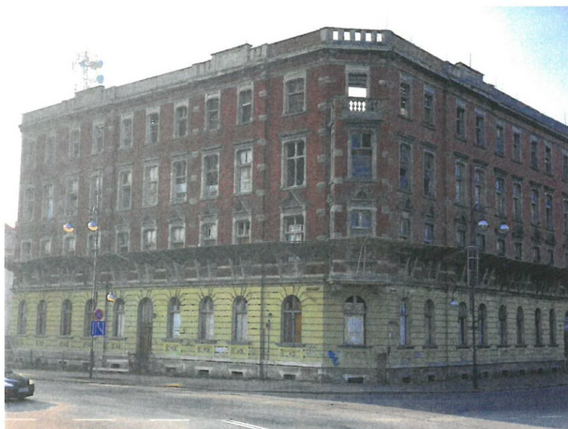
Rys. 5. Widok budynku od strony ulic Żeromskiego-Łukasiewicza- stan obecny 2018r.

Obiekt został wybudowany w ostatnich latach XIX wieku lub na przełomie wieków, w stylistyce odpowiadającej charakterowi kamienic mieszczańskich tego czasu. Istnieje wyraźna różnica akcentów dla elewacji ulicznych i dla elewacji zapleczych. Elewacje uliczne zostały stworzone jako tradycyjne, bazujące na idei wielkiego porządku (choć może w tym wypadku- raczej na pozostałościach tej idei), z podkreśleniem występowania form detalu budowlanego, ozdobnego okiennego jak i elementów elewacji właściwej w postaci gzymsu wieńczącego a także boniowanego pasa kondygnacji parteru. Zastosowano na tych elewacjach ponadto zróżnicowanie materiałowe łącząc ze sobą cegłę licówkę oraz tynk. Także stolarka okienna i drzwiowa, choć zachowana jedynie we fragmentach, prezentuje interesujący zamysł oraz bogactwo detalu. Całość zabiegów w połączeniu z interesującym oraz nowatorskim, z uwagi na czas powstania obiektu, zastosowaniem prefabrykowanych elementów betonowych dla detalu wokółokiennego, czyni obie elewacje uliczne najbardziej wartościowymi elementami całego budynku i nakazuje szczególne ich traktowanie zarówno na etapie prac projektowych jak i budowlanych.