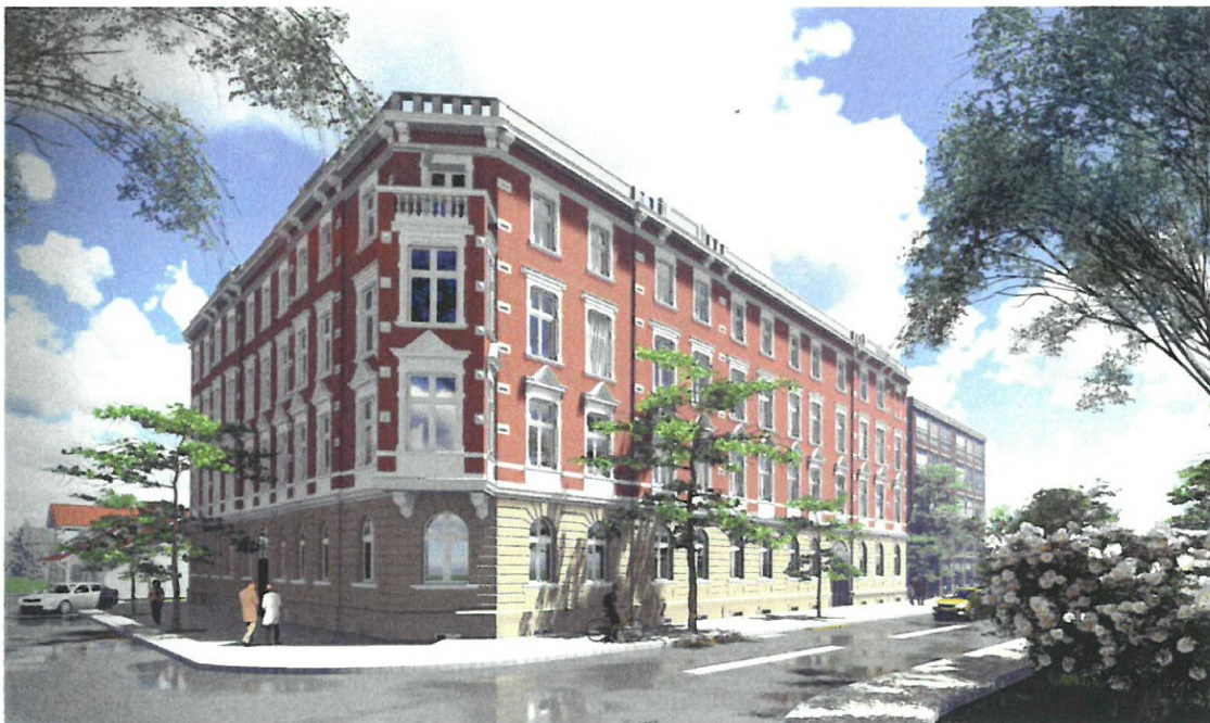
Rys. 4. Widok budynku od strony ulic Żeromskiego-Łukasiewicza- wizualizacja koncepcji

Z uwagi na charakter inwestycji nie można mówić również o kształtowaniu kompozycji architektonicznej zespołu zabudowy. Przebudowa budynku oraz przywrócenie mu charakteru budynku użytkowanego, ale jednocześnie będącego zabytkiem rejestrowym nakazuje wykonanie zadania w ramach odpowiednich wytycznych i procedur postępowania w robotach budowlanych. Poniżej pokazano docelowy wygląd przedmiotowego budynku po zakończeniu inwestycji.