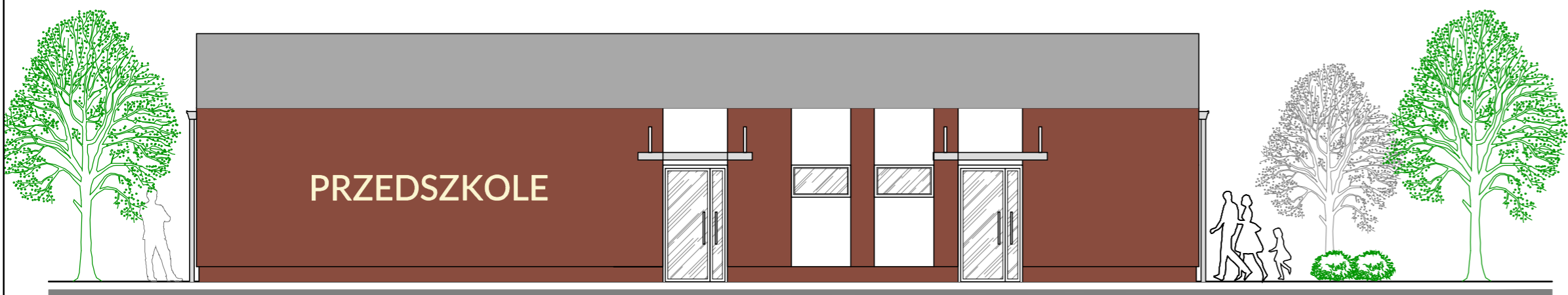
ELEWACJA PÓŁNOCNO - WSCHODNIA