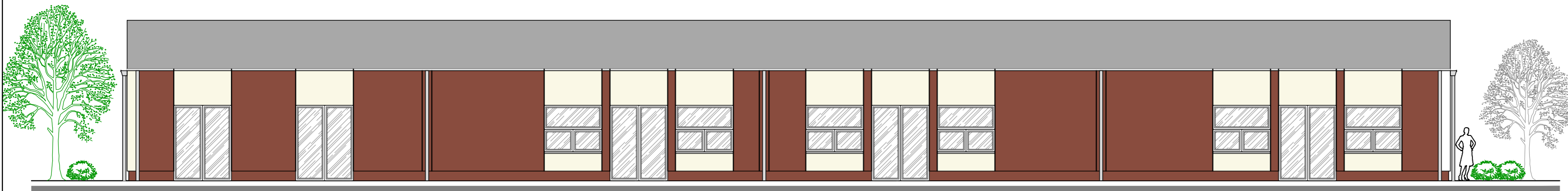
ELEWACJA POŁUDNIOWO - WSCHODNIA