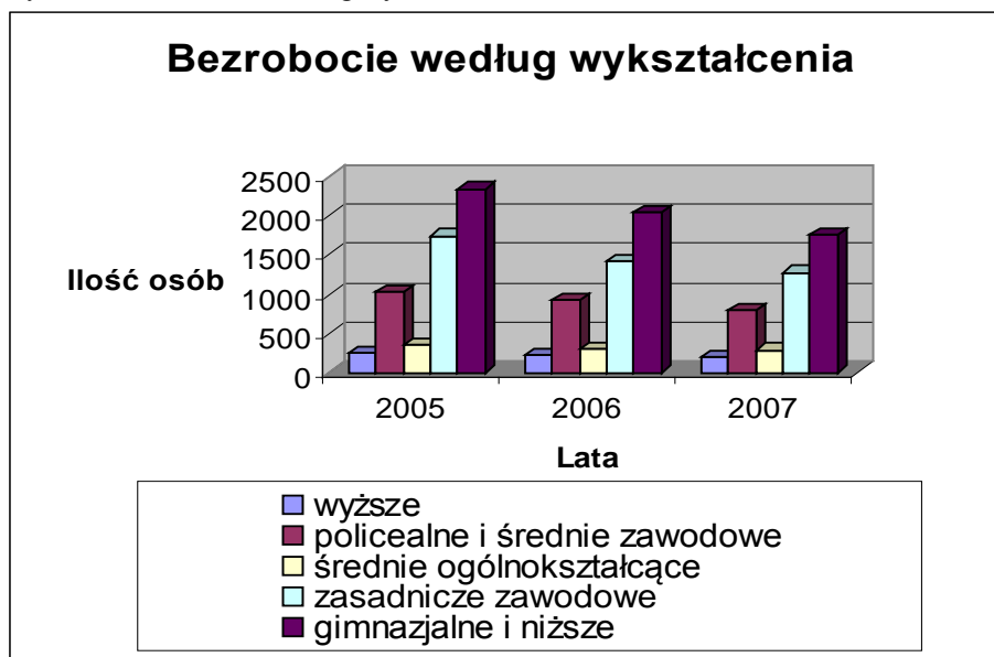
Wykres 2. Bezrobocie według wykształcenia - lata 2005 - 2007

Źródło: Powiatowy Urząd Pracy w Kędzierzynie – Koźlu.