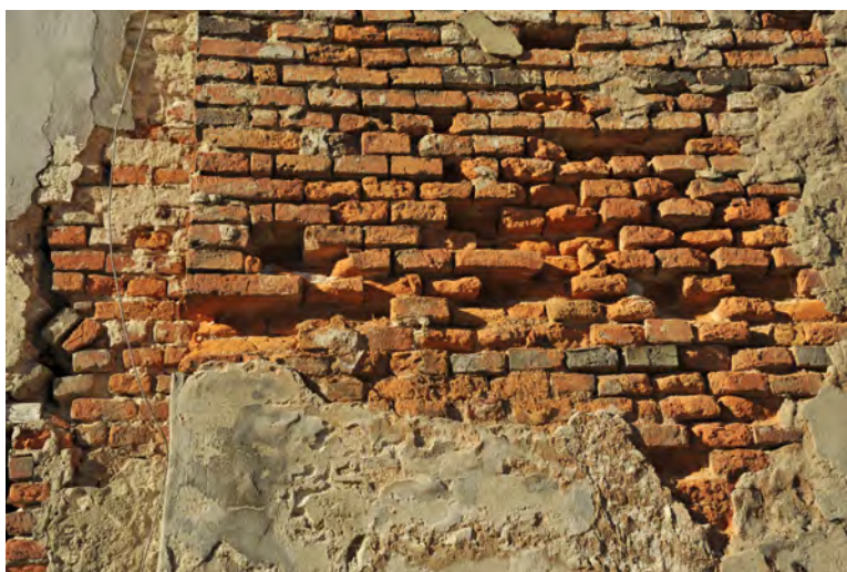
Ubytki cegieł w ścianie zewnętrznej podzamcza