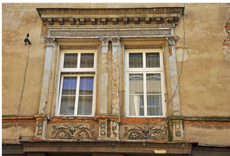
Niszczący detal architektoniczny kamienicy przy ul. Sądowej 4

Kamienica przy ulicy Sądowej 4 (przełom XIX i XX wieku), o eklektycznym detalu architektonicznym, wymaga remontu elewacji.