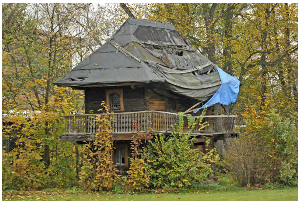
Chatka syberyjska (stan w październiku 2012 r.)

W parku, zgodnie z zasadami malowniczości, nowej kategorii estetycznej wprowadzonej na przełomie XVIII i XIX wieku, znalazły się różnego rodzaju pawilony. Jeden z elementów parku stanowiła do II wojny światowej chatka syberyjska (nr rej. 2054/80 z dn. 10.09.1980), ustawiona około 1800 roku. Drewniana, o konstrukcji zrębowej, dwukondygnacyjna, nakryta jest dachem namiotowym. Piętro obiega galeryjka, na którą z parteru prowadzi drabina. Przeniesiona na teren przy plebanii, znajduje się obecnie w bardzo złym stanie technicznym. Od wielu lat czynione są przez parafię bezskuteczne starania o przekazanie obiektu do Muzeum Wsi Opolskiej w Opolu-Bierkowicach. Z uwagi na brak sakralnego charakteru lub funkcji związanej ze sprawowaniem kultu religijnego, niemożliwe jest uzyskanie finansowania prac konserwatorskich ze środków kościelnych. Obecnie podjęto doraźne prace mające na celu zabezpieczenie dachu pawilonu przed czynnikami zewnętrznymi w okresie zimowym.