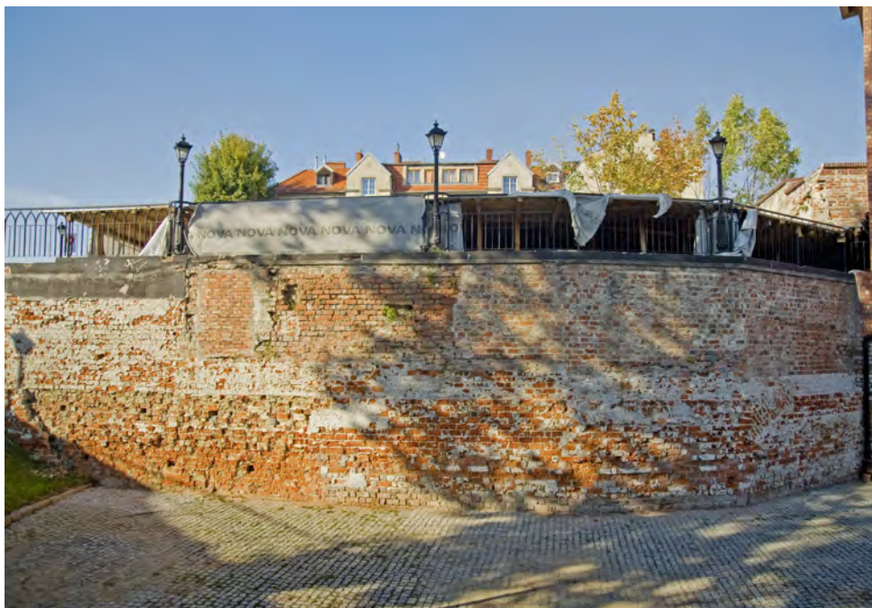
Budynek południowy zamku

obrysie, renesansowa baszta artyleryjska, użytkowana obecnie jako siedziba Muzeum Ziemi Kozielskiej, piwnice budynku południowego i ruiny lamusa na terenie górnego zamku oraz renesansowe przedzamcze, z relikdami gotyckimi.