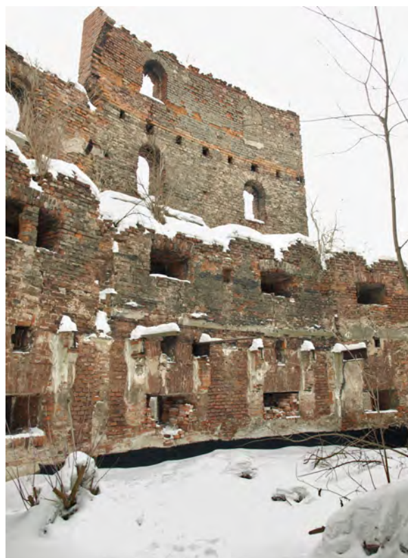
Wnętrze Fortu im. Fryderyka Wilhelma