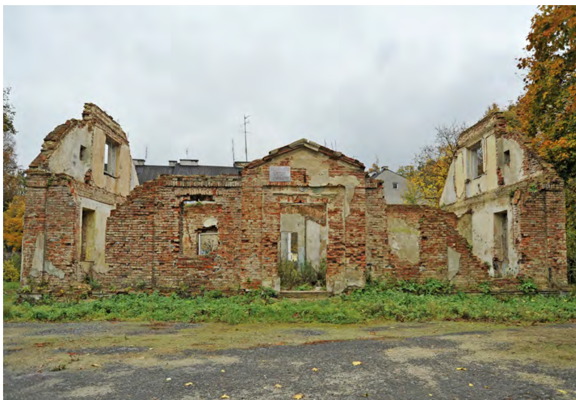
Dom ogrodnika (stan w październiku 2012 r.)

W skład zespołu pałacowo-parkowego wchodził także tzw. dom ogrodnika (nr rej. 2055/80 z dn. 11.09.1980), wzniesiony ok. 1830 roku, w pobliżu ogrodu francusko-holenderskiego (zamienionego później na ogród warzywny). Obecnie dom jest w stanie ruiny, pozbawiony pokrycia dachowego, ścian działowych i części ścian zewnętrznych. Kwalifikuje się do wykreślenia z rejestru zabytków. Decyzja o skreśleniu należy do kompetencji Generalnego Konserwatora Zabytków, działającego w imieniu Ministra Kultury i Dziedzictwa Narodowego.