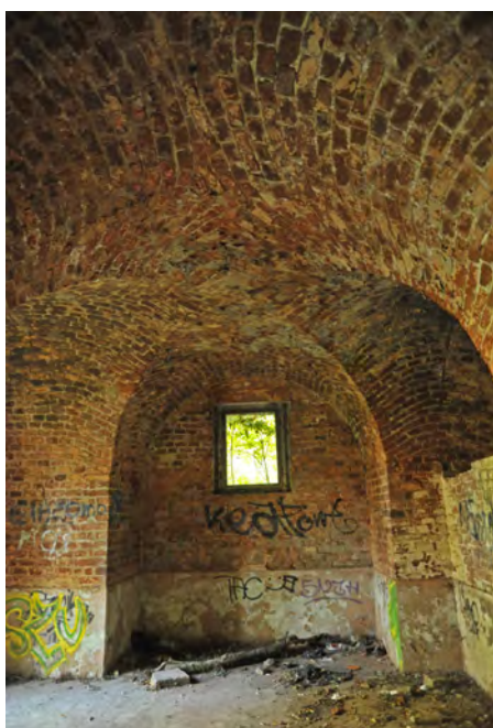
Wnętrze prochowni przy końcu ul. Skarbowej