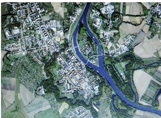
Zdjęcie satelitarne współczesnego Koźła

W 1873 roku Koźle straciło status twierdzy. Rozpoczęła się wówczas likwidacja lub adaptacja zabudowań fortecznych dla celów cywilnych.