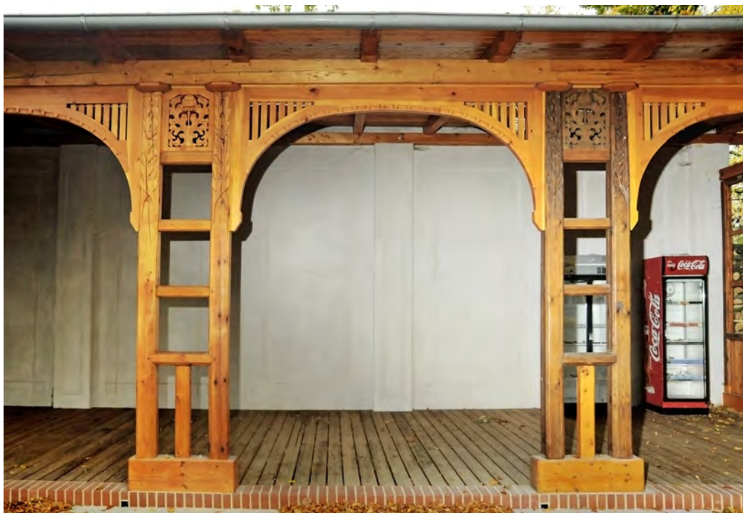
Leżakownia - połączenie zrekonstruowanej snycerki z elementami oryginalnymi

Na terenie Kędzierzyna, spośród zabudowy miejskiej, powstającej od końca XIX wieku, do godnych uwagi należą dwie kamienice, objęte ochroną konserwatorską na mocy wpisu do rejestru zabytków: