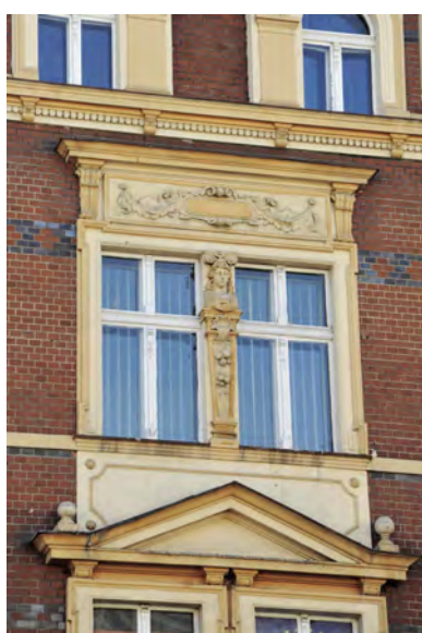
Detal architektoniczny kamienicy przy ul. Piastowskiej 1