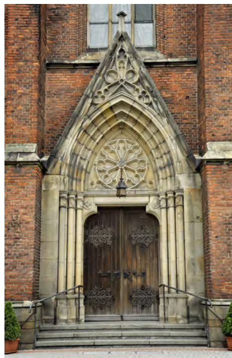
Kościół pw. św. Katarzyny Aleksandryjskiej - portal główny