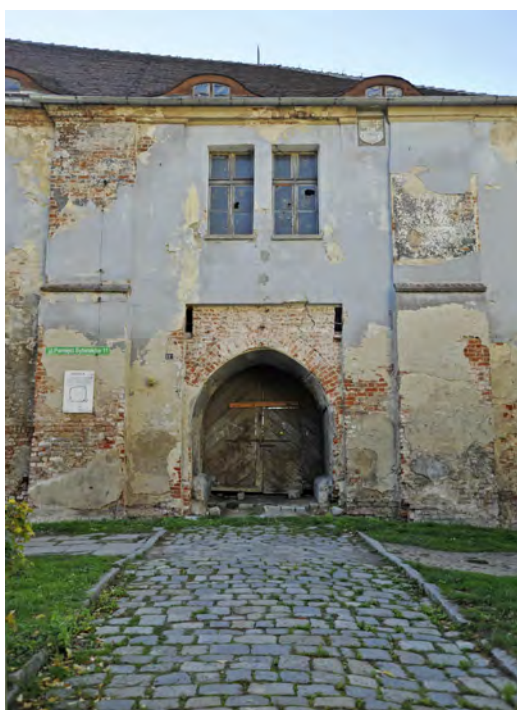
Podzamcze - brama wjazdowa