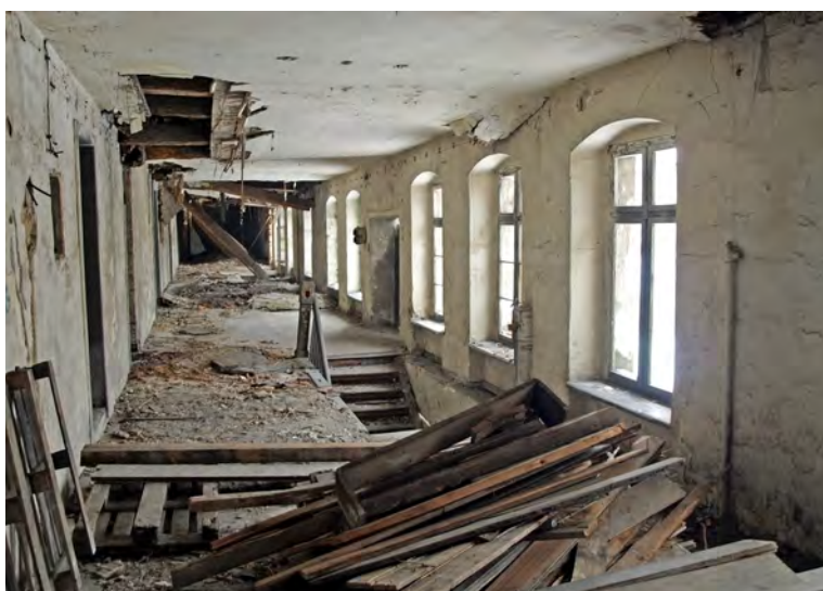
Zdewastowane wnętrze podzamcza