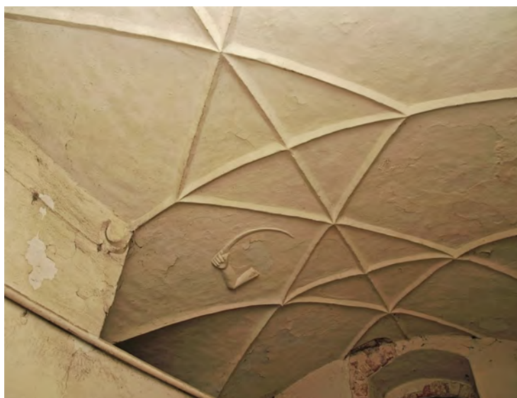
Podzamcze – sklepienie sieni