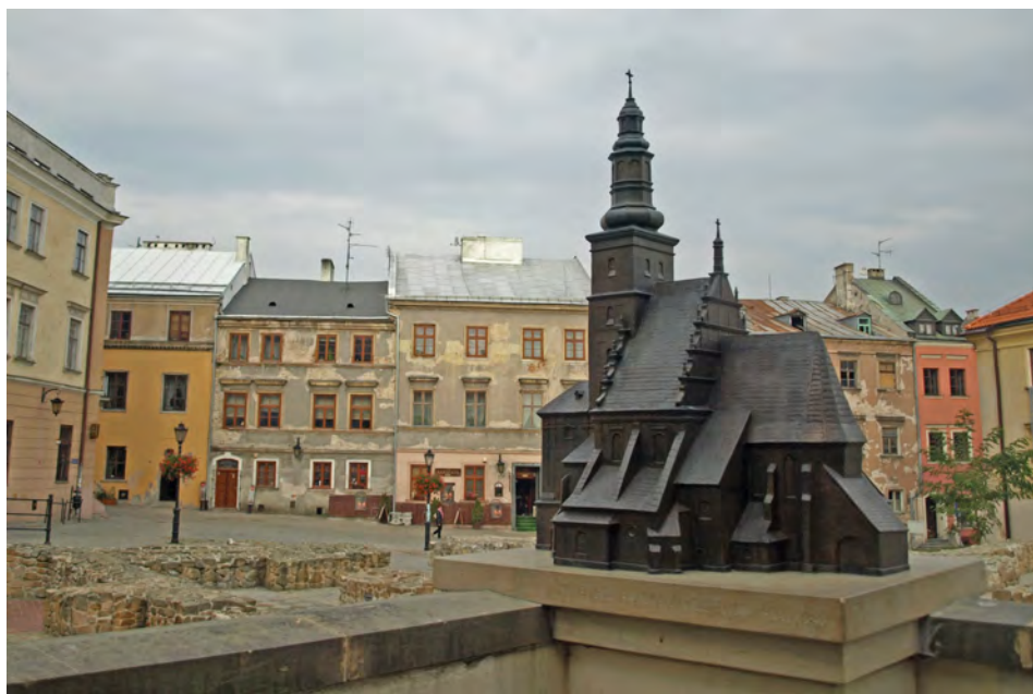
Przykład makiety w przestrzeni miejskiej - model kościoła św. Michała Archaniola w Lublinie w skali 1:40

temat historii obiektu. Tego rodzaju model harmonizowałby z estetyką starego miasta, pełnił funkcję informacyjno-edukacyjną dla ogółu mieszkańców i turystów przy jednoczesnym umożliwieniu osobom niepełnosprawnym (słabowidzącym i niewidzącym) skorzystania z tej formy prezentacji.