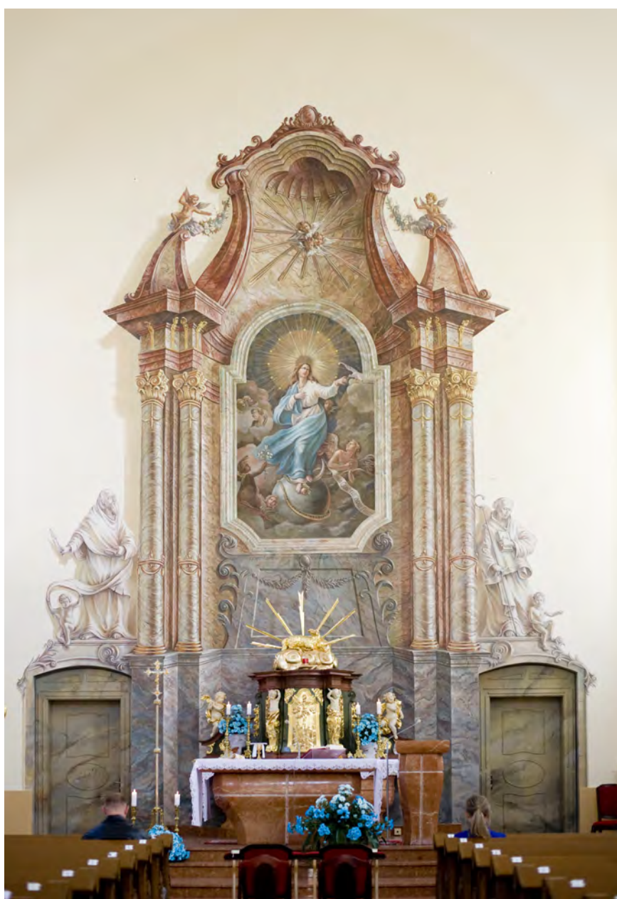
Kościół pw. Wniebowzięcia NMP - polichromia ołtarzowa

KsB.t.III/IV-634/1-10/75 z dn. 25.09.1975r.). 14 sierpnia 2010 roku nastąpiło ponowne poświęcenie ołtarza. W 2010 roku przystąpiono do remontu elewacji zewnętrznych. Skuto tynk elewacji i przemurowano spękany odcinek. W 2011 roku oczyszczono mury fundamentowe i ściany piwnic oraz wykonano ich izolację. Wykonano także tynki elewacji frontowej, z odtworzeniem gzymsów, lizen, opasek i portalu wejściowego. W następnym roku wykonano tynki elewacji południowej kościoła. Zakończenie prac, w tym malowanie elewacji, planowane jest na połowę 2013 roku.