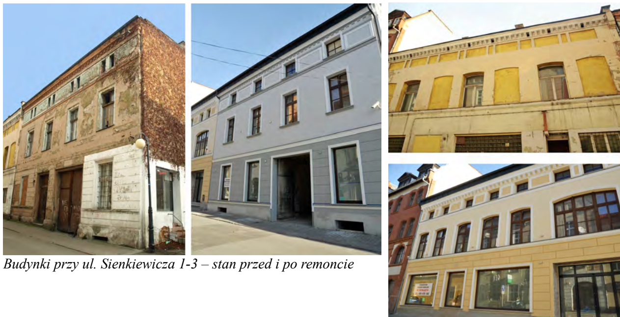
Budynki przy ul. Sienkiewicza 1-3 – stan przed i po remoncie

Po zniesieniu twierdzy w trzeciej ćwierci XIX wieku rozpoczął się rozwój urbanistyczny, związany zwłaszcza z powstaniem kamienic czynszowych, na ogół w mniej zwartej zabudowie i na większych parcelach niż te zdeterminowane średniowiecznym układem starego miasta. Główną ulicą, wzdłuż której powstał ciąg dziewiętnastowiecznej zabudowy jest obecna ul. Piastowska, stanowiąca przedłużenie głównej osi miasta, biegnącej wzdłuż boku rynku w kierunku północno-zachodnim.