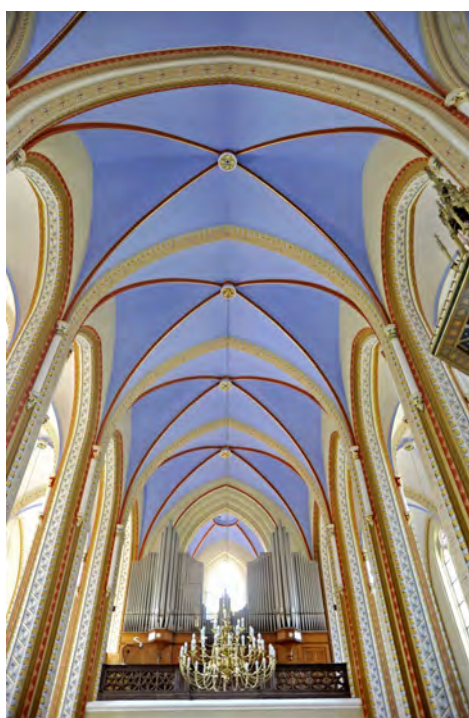
Wnętrze kościoła pw. św. Katarzyny Aleksandryjskiej