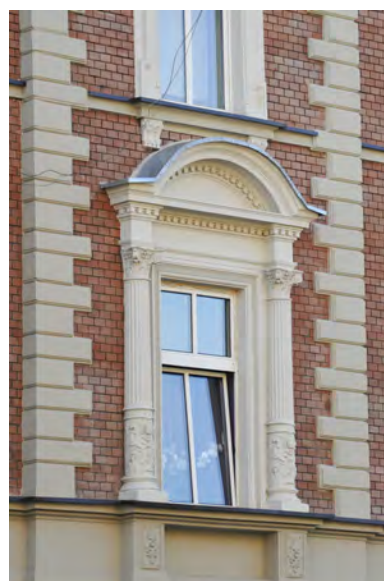
Detal architektoniczny kamienicy przy ul. Piastowskiej 9