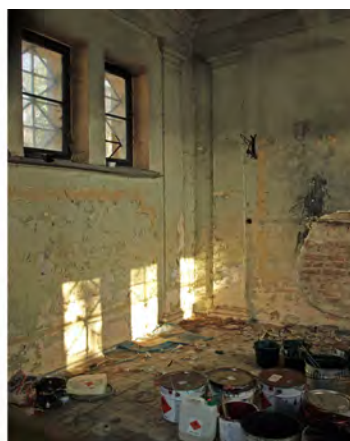
Kaplice cmentarne i ich zdewastowane wnętrza