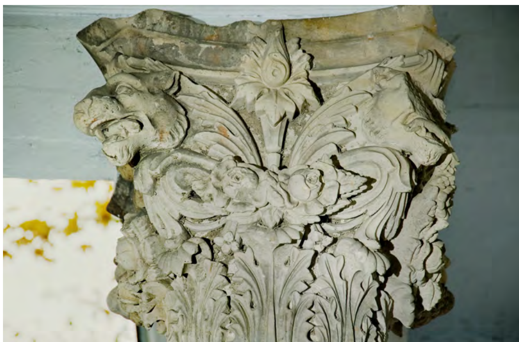
Jeden z kapiteli portyku

Stan techniczny obiektu jest dostateczny. W kilku miejscach belkowania występują niewielkie ubytki tynku. Większość kapiteli jest uszkodzona. Efekt wizualny znacznie pogarsza pseudograffiti.