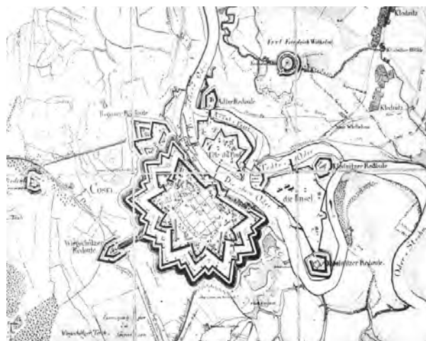
Plan twierdzy Koźle z 1851 r.

Koźle jest rzadkim przykładem twierdzy kleszczowej powstałej w epoce dominacji fortyfikacji bastionowej. Mimo znacznych przekształceń zachowała ona swój oryginalny narys. O jej wyjątkowości na tle innych twierdz śląskich decyduje także wyjątkowo duża liczba kazamat.