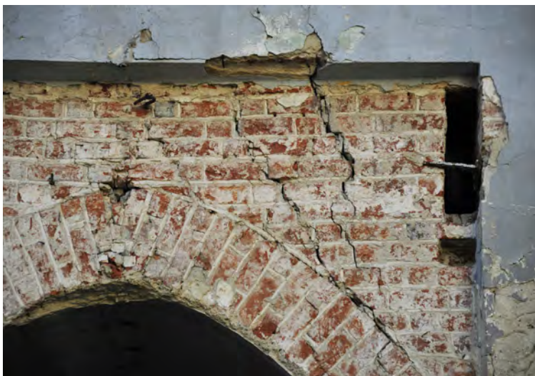
Zniszczenia w substancji bramy podzamcza