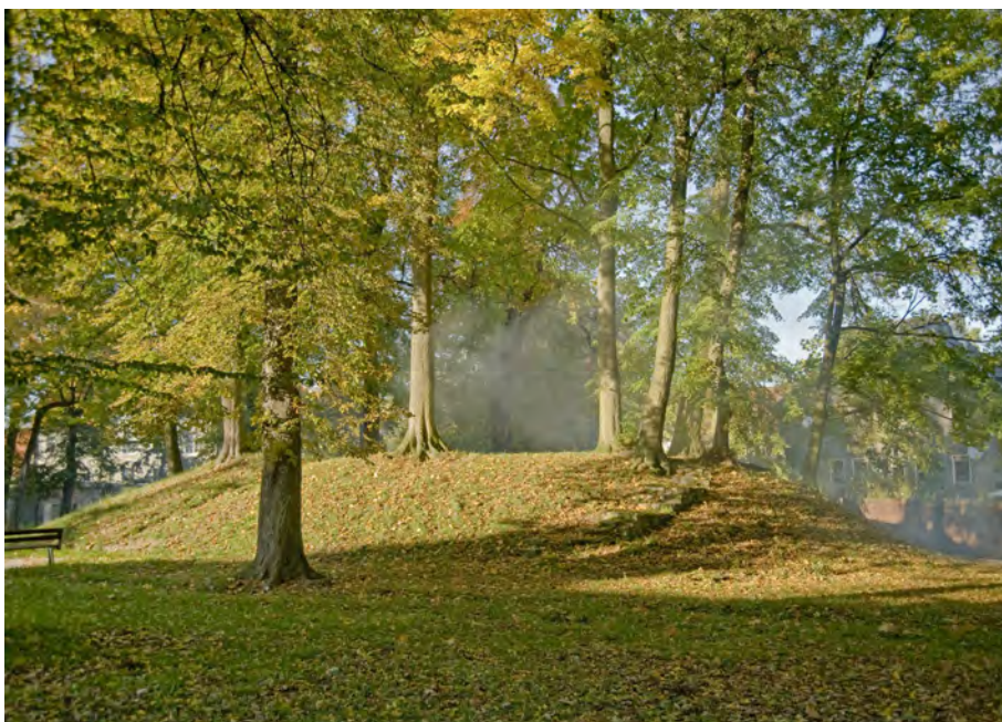
Pozostałości Reduty Reńskowiejskiej przy ul. Skarbowej

Ponadto wiele zachowanych elementów twierdzy nie zostało dotąd włączonych do rejestru ani ewidencji zabytków.