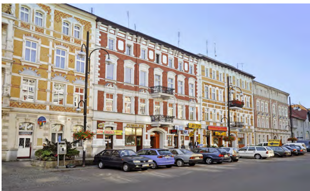
Zabudowa pierzejowa przy ul. Piastowskiej 1-9

Pozostałe kamienice, obecnie w zróżnicowanym stanie technicznym, reprezentują styl eklektyczny z elementami secesji. Wpisem do ewidencji zabytków objęte są budynki przy ul. Piastowskiej 11, 15, 19, 24, 35, 37, 39, 44, 45, 47, 49 . Ponadto po obu stronach ulicy usytuowane są wille wzniesione przez burżuazję na przełomie XIX i XX wieku. Są to budynki pod numerami 10, 12 a-d, 20, 21, 25, 26, 32 , objęte wpisem do ewidencji zabytków.