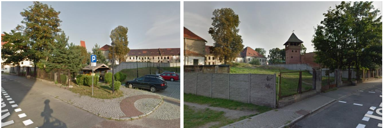
Fot.1 Zdjęcia z terenu inwestycji terenu inwestycji