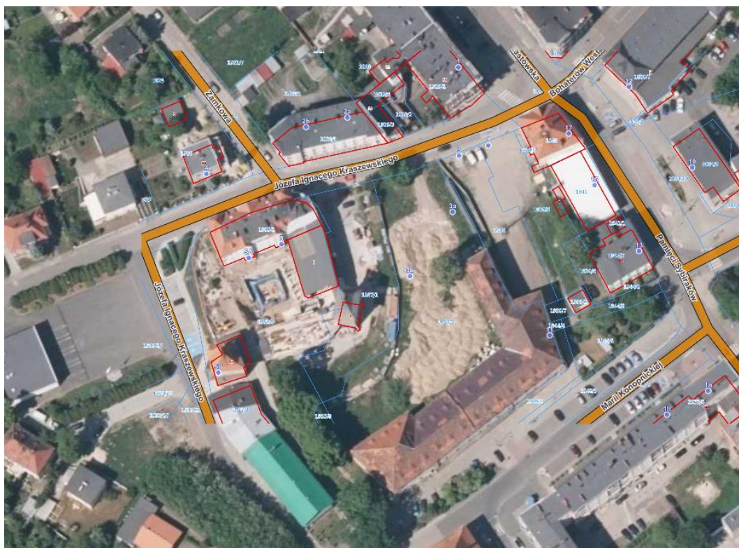
Fot.1 lokalizacja poglądowa terenu inwestycji

Przedmiotem inwestycji jest opracowanie dokumentacji projektowo-kosztorysowej budowy parkingu oraz chodnika przy ul. Ignacego Kraszewskiego na działkach 1937/2, 1938 oraz 1939/8 w Kędzierzynie Koźlu.