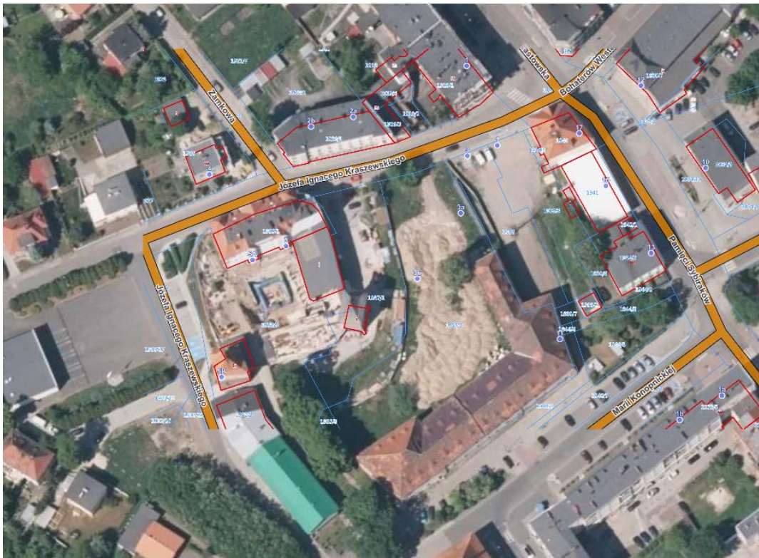
Fot.1 lokalizacja poglądowa terenu inwestycji

Przedmiotem inwestycji jest opracowanie dokumentacji projektowo-kosztorysowej budowy parkingu oraz chodnika przy ul. Ignacego Kraszewskiego na działkach 1937/2, 1938 oraz 1939/8 w Kędzierzynie Koźlu.