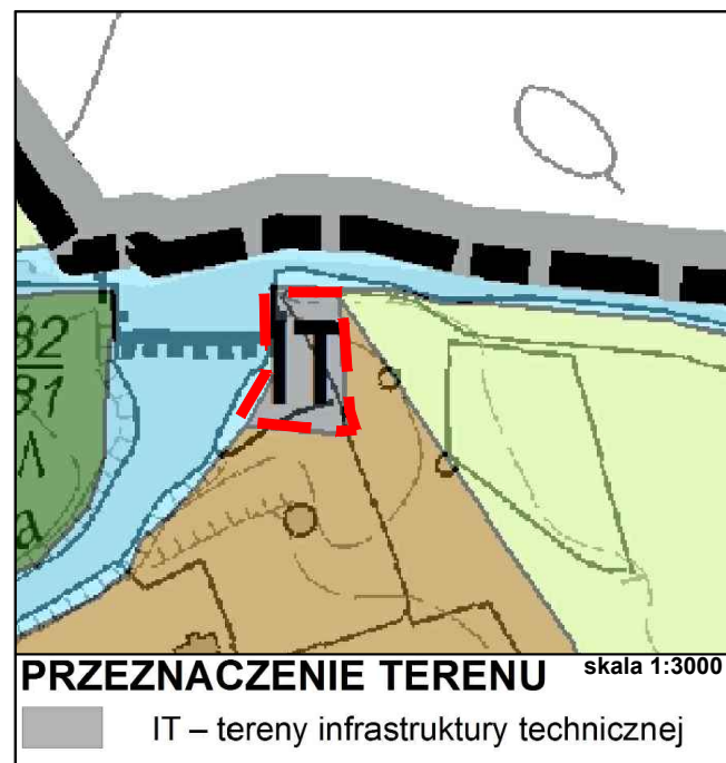
PRZEZNACZENIE TERENU skala 1:3000