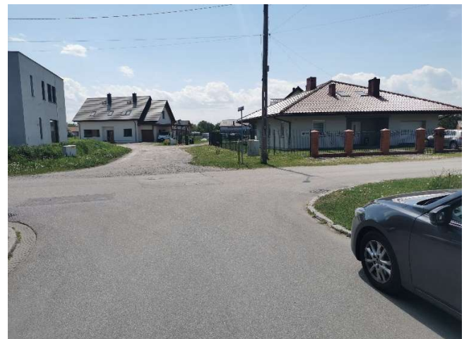
Fot.1 lokalizacja terenu inwestycji