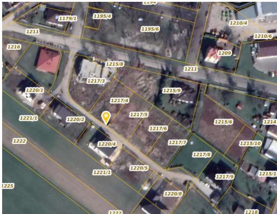
Fot.1 lokalizacja pogładowa terenu inwestycji

Zakres opracowania obejmuje opracowanie wariantowej koncepcji programowej budowy drogi tj. Ulicy Osiedlowej oraz innej infrastruktury towarzyszącej na działkach o nr ewidencyjnych 1211, 1217/2 (obręb Kłodnica).