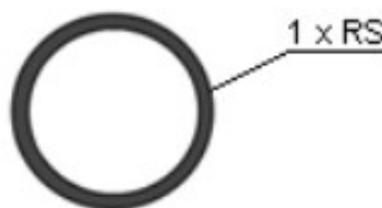
Rysunek 3 Wygląd kanału technologicznego przyłączeniowego KTpS

Do każdej działki, projekt zakłada wybudowanie przyłącze kanału technologicznego złożone z jednej rury światłowodowej RS 40/3,7mm zgodnie z rysunkiem poniżej: