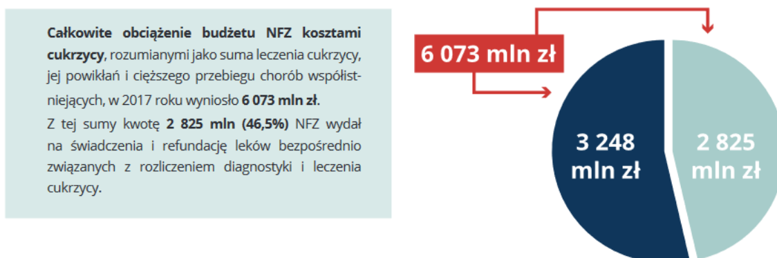
Wykres 2. Koszty ponoszone przez NFZ w 2017 roku na leczenie i rehabilitację cukrzycy, powikłania i choroby współistniejące, źródło: https://www.pzh.gov.pl/wp-content/uploads/2019/09/Rozpowszechnienie-cukrzycy-i-koszty-NFZ-a.d.-2017-1.pdf

Powikłania cukrzycy mają charakter postępujący i nieodwracalny, stanowią duże ryzyko dla pacjenta. Wpływają negatywnie na jakość życia chorych, powodują kalectwo, niezdolność do pracy i przedwczesną śmierć. Przyczyniają się do całkowitej utraty wzroku, niewydolności nerek, amputacji kończyn oraz należą do najważniejszych czynników ryzyka rozwoju choroby niedokrwiennej serca. Leczenie cukrzycy oraz jej powikłań stanowi istotne obciążenie finansów dla systemu opieki zdrowotnej.