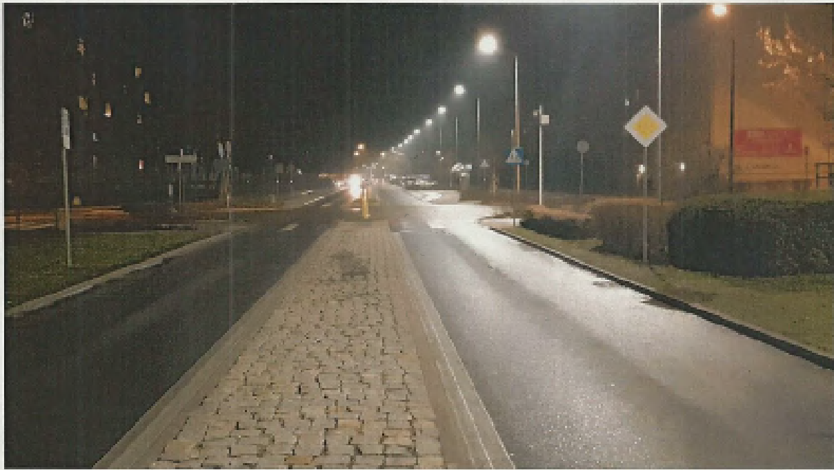
ul. W. Polskiego