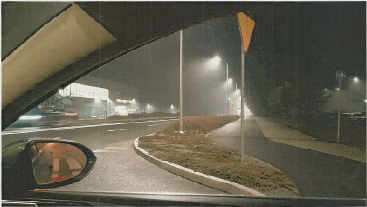
ul. Kosmonautów wjazd na al. Jana Pawła II