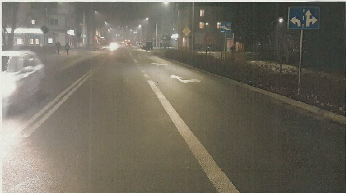
al. Jana Pawła II / ul. Judyma