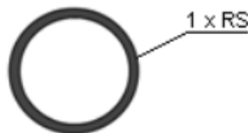
Rysunek 3 Wygląd kanału technologicznego przyłączeniowego KTps

Do każdej działki, projekt zakłada wybudowanie przyłącze kanału technologicznego złożone z jednej rury światłowodowej RS 40/3,7mm zgodnie z rysunkiem poniżej: