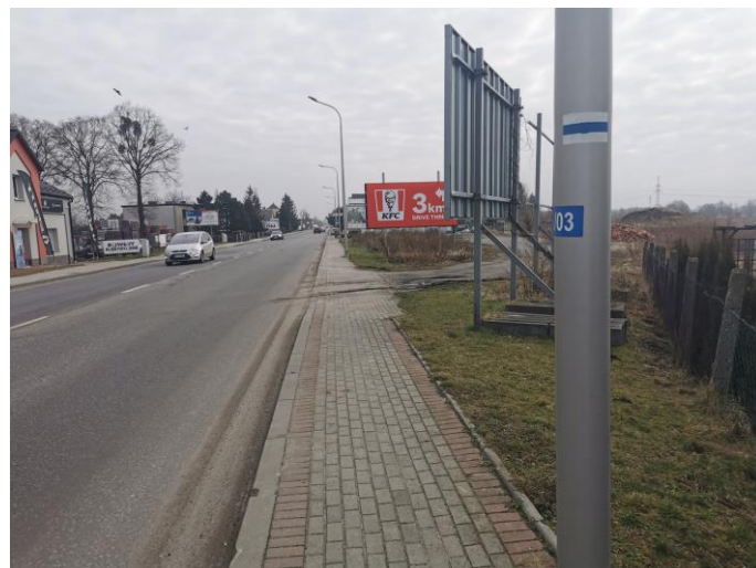
Fot.1 lokalizacja terenu inwestycji