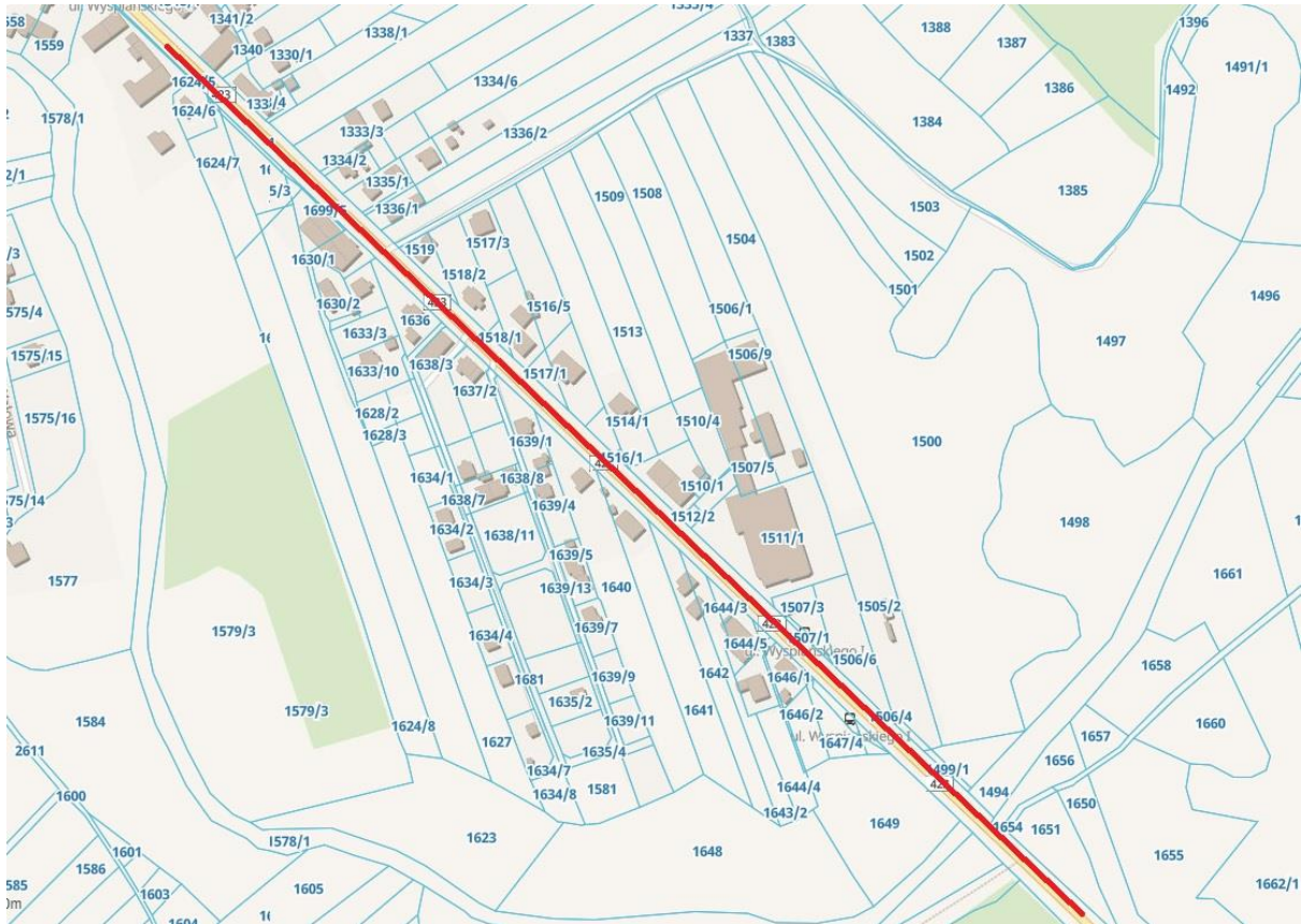
Fot.1 lokalizacja poglądowa terenu inwestycji

Zakres opracowania obejmuje opracowanie wariantowej koncepcji programowej przebudowy ul. Wyspiańskiego w celu utworzenia ciągu rowerowego lub pieszo - rowerowego. W ramach opracowania zaprojektować należy przebudowę drogi publicznej gminnej o kategorii ruchu KR5 i klasie drogi Z o długości ok. 1000 m szer. ok 10,0 m. oraz innej infrastruktury towarzyszącej na działkach o nr ewidencyjnych 1579/2, 1521/4, 1647/3, 1529/1, (obręb Koźle).