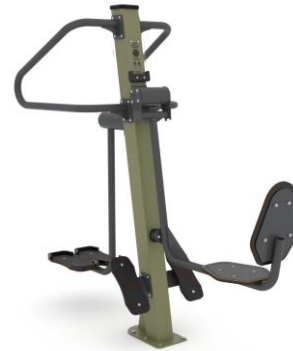
2. Wahadło/Prasa nożna