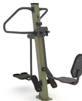
8. Wahadło/Prasa nożna