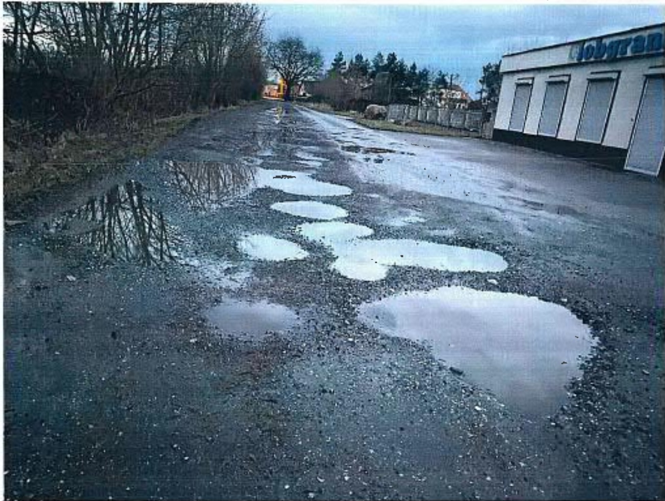
3 Zdjęcia przykładowe przykładowe obecnego stanu ul. Czeremchowej